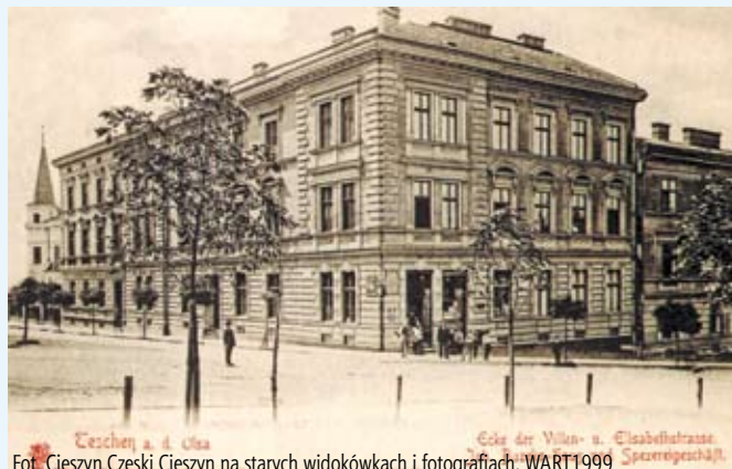
Budynek LOTE, 1905