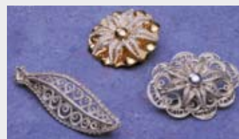
Ozdoby wykonane przez Pana Pieczonkę