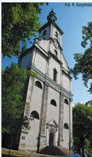
Kościół Jezusowy, 2008

Testk pochodzi z ulotki pt. „Szlakiem pamiątek ewangelików cieszyńskich” wydanej przez Biuro Promocji i Informacji UM. Można ją bezpłatnie otrzymać w Cieszyńskim Centrum Informacji (Ratusz, parter).