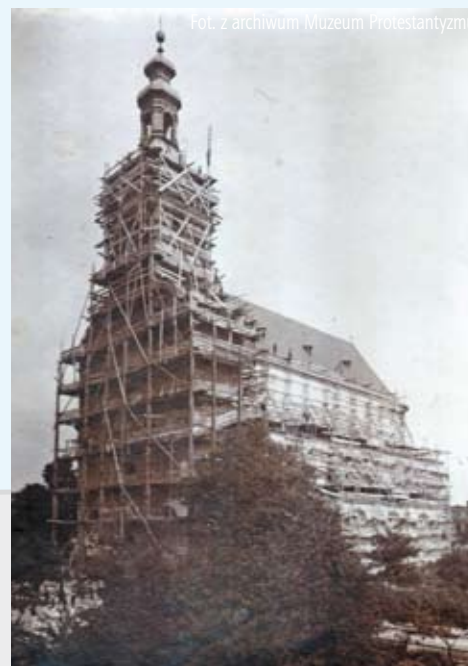
Remont fasady na obchody 200-lecia kościoła, 1908

Zapraszamy Czytelników do współredagowania tej strony. Prosimy o nadsyłanie ciekawostek związanych z Cieszynem (np. anegdot, przepisów kulinarnych, zdjęć, dokumentów, wzorów rękodzieła artystycznego itp.), które mogłyby zainteresować innych i wzbogacić wiedzę o naszym mieście. Gwarantujemy zwrot wszystkich otrzymanych materiałów.