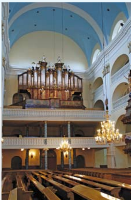
Wnętrze kościoła, 2008