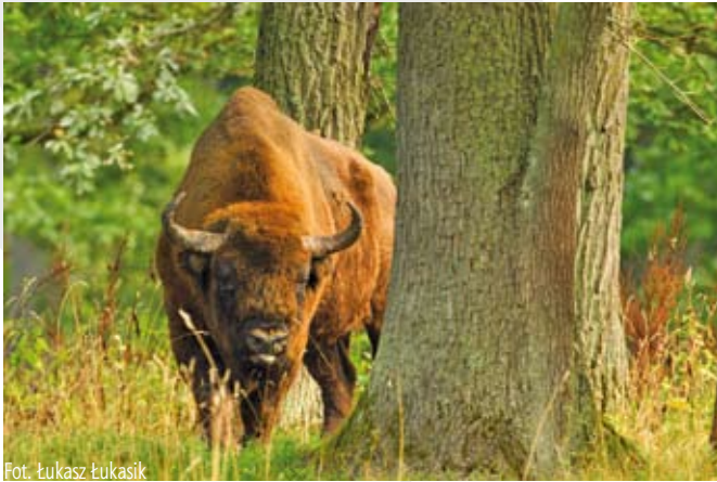
Fot. Łukasz Łukasik

29 października w siedzibie Biblioteki Miejskiej w Cieszynie odbył się wernisaż fotografii przyrodniczej autorstwa Łukasza Łukasika.